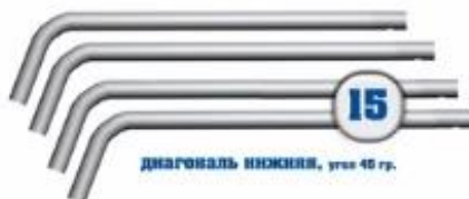
диагональ нижняя, угол 45 гр.