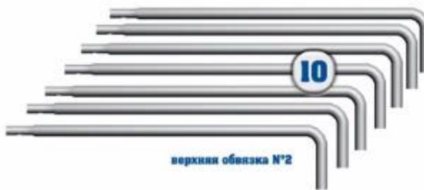
верхняя обвязка №2