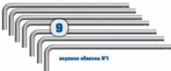
верхняя обвязка №1