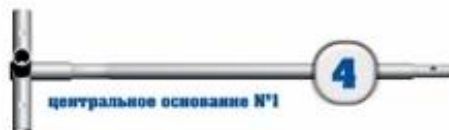
центральное основание №1