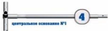
4 центральное основание №1