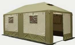
окна и двери