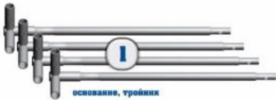
1 основание, тройник