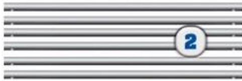
2 перемычка основания